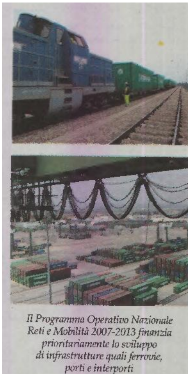
Il Programma Operativo Nazionale Reti e Mobilità 2007-2013 finanzia prioritariamente lo sviluppo di infrastrutture quali ferrovie, porti e interporti

sistemi di trasporto intelligenti, per attribuire al Meridione un ruolo strategico nel bacino del Mediterraneo. Puntando in modo particolare – con più del 70% delle proprie risorse –